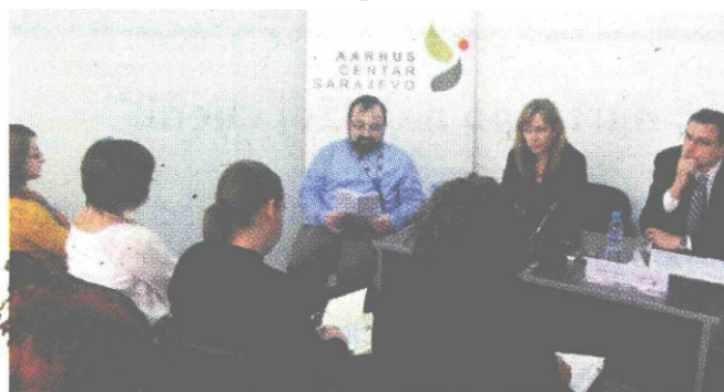
S jučerašnjeg održanog seminara

- Prvi i osnovni cilj je iskoristiti još jedan od mehanizama kako bi se građanke i građani aktivnije uključili u proces donošenja odluka, koje značajno utječu na kvalitet života u ovom gradu i zemlji. Aarhuska konvencija, na čiju se primjenu BiH obvezala 2008., upravo se bavi zaštitom okoliša - oblašću koja u sebi krije ogroman potencijal, objasnio je zamjenik